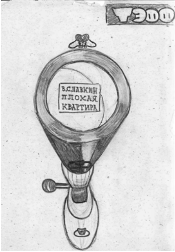
1977 Эскиз афиши спектакля (В.Дмитриев).

стекляной) были помещены стенды, на которых и размещались все афиши.