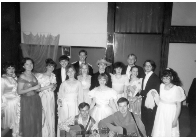
1999 Пушкинский вечер.

Пушкинский вечер начался с полонеза в исполнении 12-ти пар, затем вальс Пушкина и Натали, классическая музыка, арии в исполнении профессионального оперного певца: всё это гармонично переплелось с отрывками из произведений поэта. В целом, выступление прошло успешно и интересно».